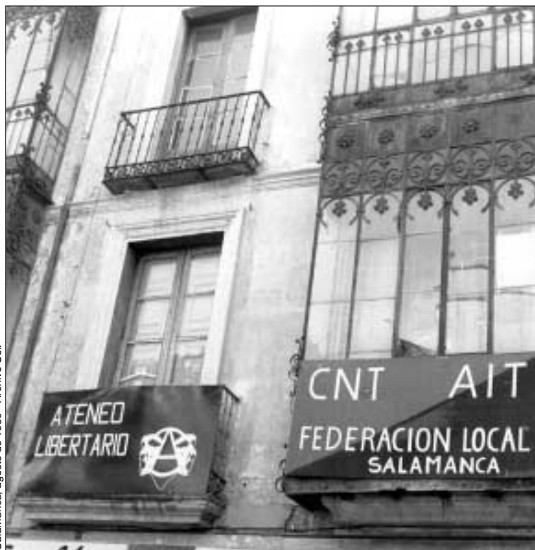
Salamanca, agosto de 1989

Así, por ejemplo, el naturismo, como medio de enriquecer la salud colectiva; el libre acuerdo para