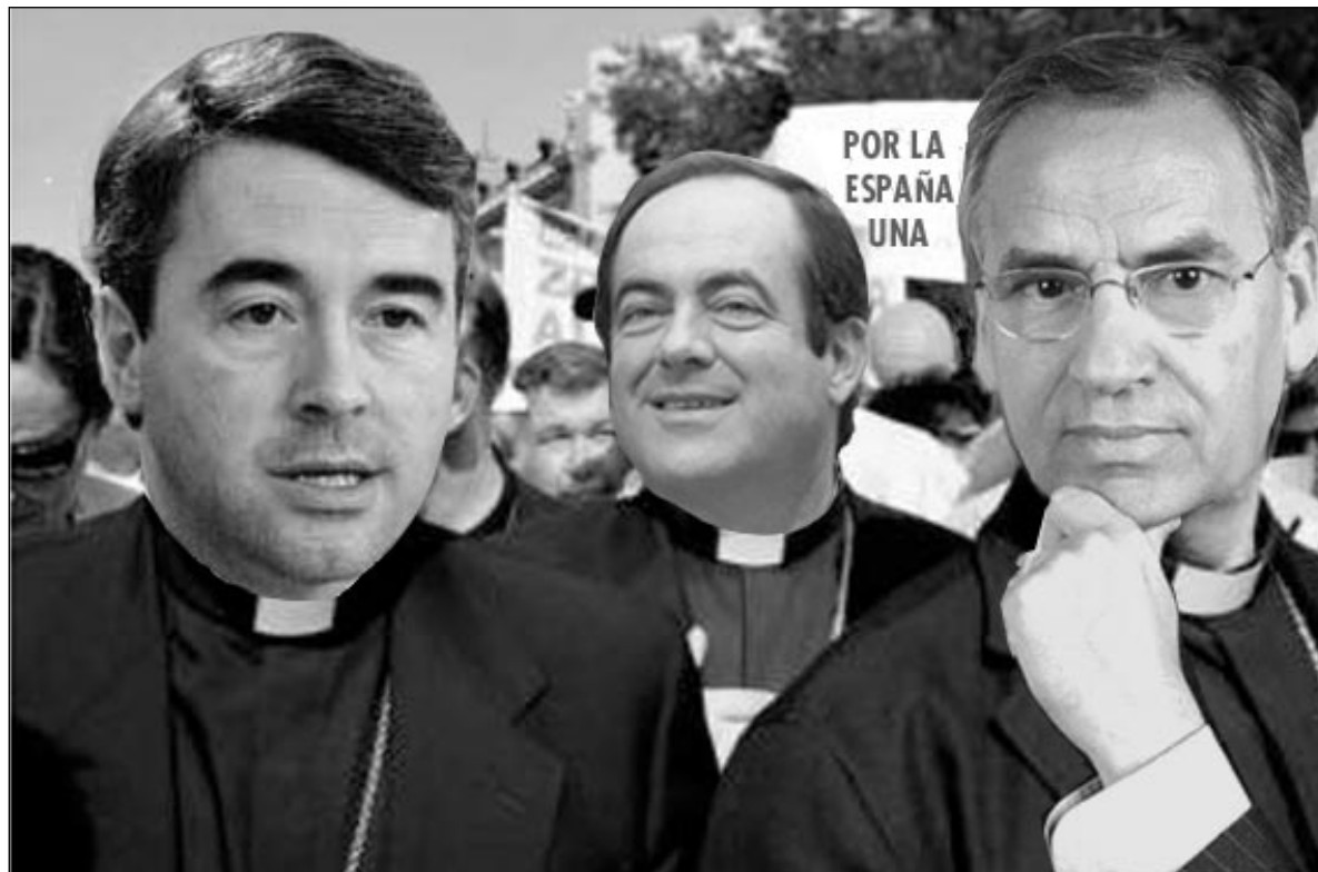
Conspiració de descamisats amb els del PP per a tractar de descarrilar l'Estatut.

Que els seus pronunciaments displicents, molt sovint tocant la xuleria, no contradueixin sinó que confirmen l'esperit «socialista» d'aquest sistema fiscal irreformable, ha quedat clar per allò que al projecte de l'Estatut podem trobar com a definició de què és fiscalment solidari: «Un sistema fiscal regit pel principi d'obtenir un nivell de serveis similar per un esforç fiscal similar». Expressió aquesta que, malgrat semblar en termes globals quantitativament equitativa no deixa de ser en termes qualitius de classe i de justícia redistributiva per a Catalunya també summament insolidària. Que aquests matisos se'ls escapen intencionadament a gens com, entre d'altres, el plomós Bono, es posa de manifest quan comencen a malparlar de les catalanes sanitàries demandes, confonent-hi les ex-