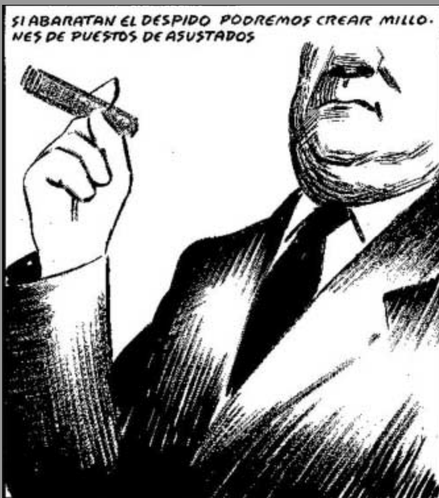
La viñeta destacada EL ROTO, (El País, 23-10-08)

Es por ello que la sentencia, salvo para el orgullo policial de los mossos», terminará siendo lo de menos. Lo que verdaderamente preocupa a quienes nos controlan y legislan, hasta el punto de exigir una llamada al orden, es que se les escape cualquier atisbo de connivencia entre los distintos estamentos del poder.