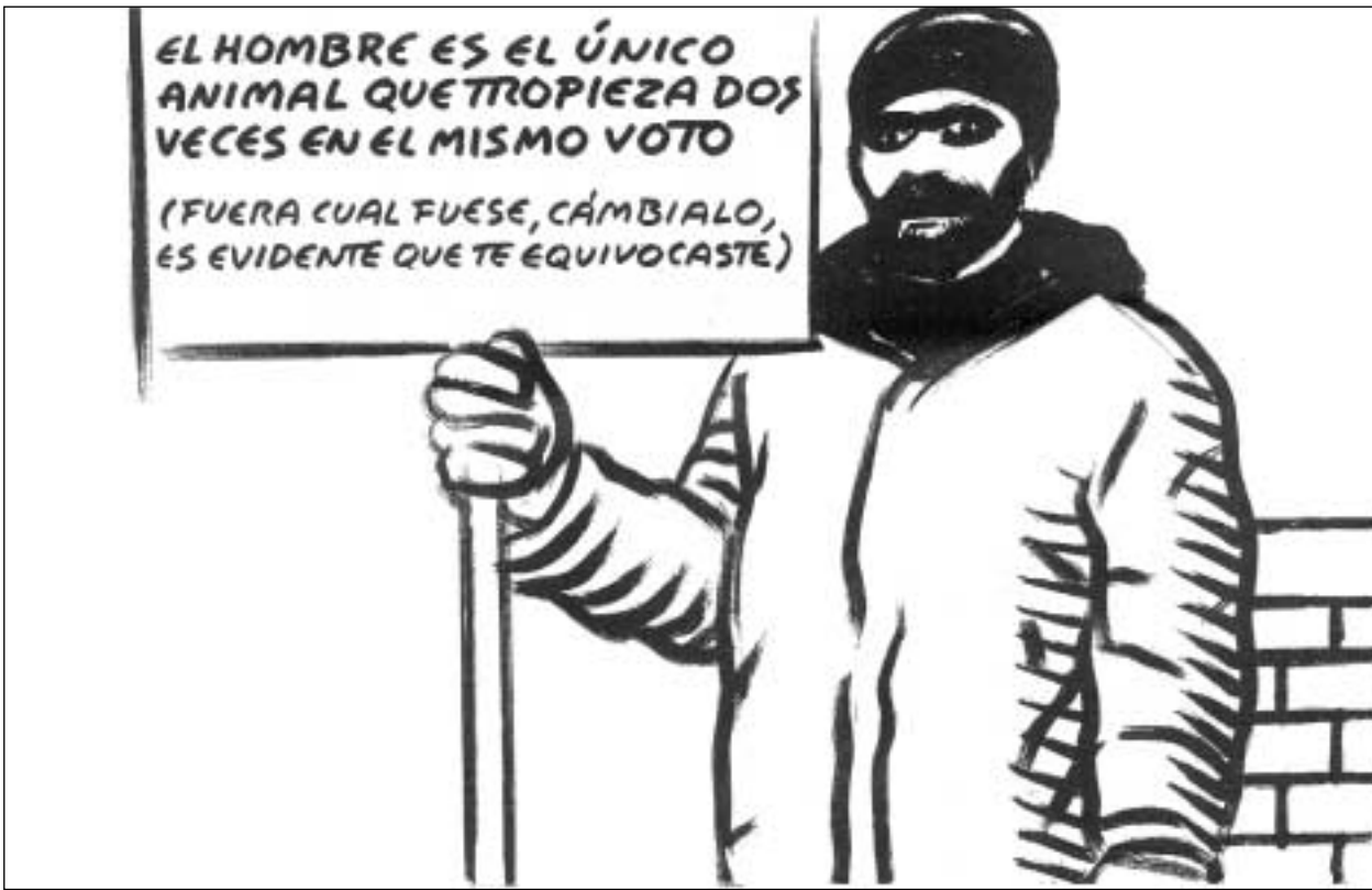
EL ROTO (extraído del periódico EL PAÍS - 3-3-2004)

Ante todo este horror, ante tanta vergüenza, la apuesta del anarcosindicalismo sigue siendo la máxima autogestión posible de la vida social y su educación en el pensamiento crítico y en el desarrollo de las propias posibilidades. Para que no nos manipulen y exploten con tanta impunidad. Para poder ser nosotr@s mism@s. Para que no maten en nuestro nombre. Para que no nos maten en los trenes de un 11 de marzo fatal, definitivo.