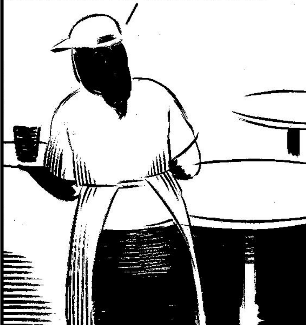
La viñeta destacada EI ROTO , ( El País , 15-7-08)

TODO ES COHERENTE: EL CONTRATO BASURA, EL TRABAJO DE MIERDA Y LA PORQUERÍA DE SUELDO